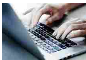
METLIFE EUROPE DAC: offerta di preventivi contraffatti di polizze TCM