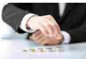
Fondi pensione: la tassazione del capital gain