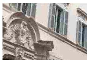
Emanato il Provvedimento che modifica Regolamento 14/2008 sul trasferimento di portafogli in run-off